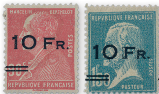
Los 2613 | Ausruf: 4.000 € Zuschlag: 5.150 €