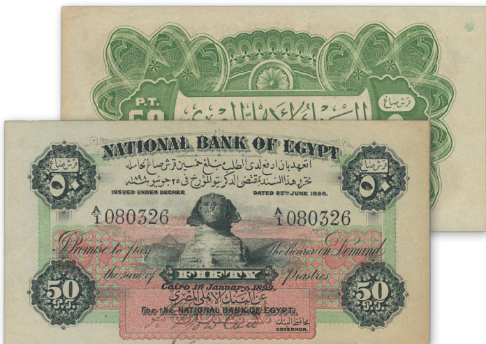
Los 1107 | Ausruf: 8.000 € | Zuschlag: 35.000 €