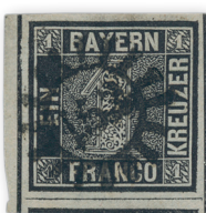
Los 5037 | Ausruf: 1.000 € Zuschlag: 2.100 €