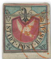
Los 3099 | Ausruf: 2.500 € Zuschlag: 3.300 €