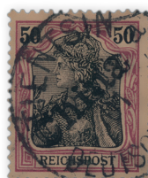
Los 5710 | Ausruf: 3.000 € Zuschlag: 5.000 €