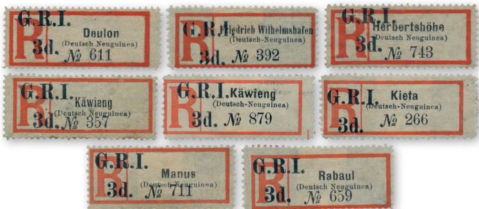
Los 5775 | Ausruf: 5.000 € | Zuschlag: 14.500 €