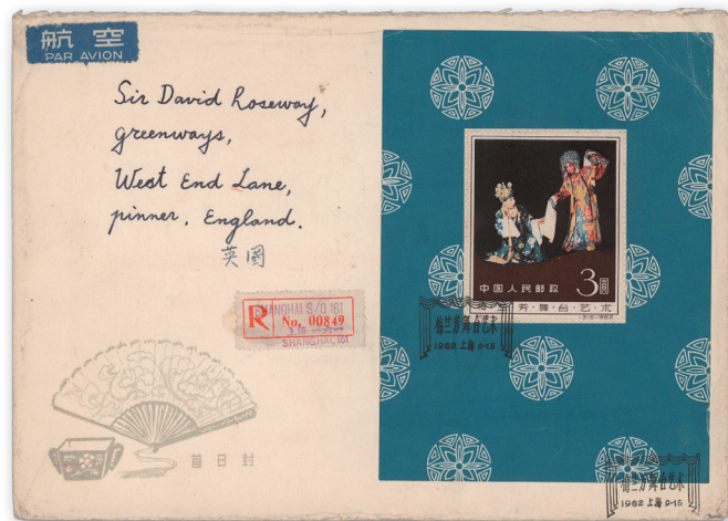
Los 3752 | Ausruf: 2.500 € | Zuschlag: 10.000 €