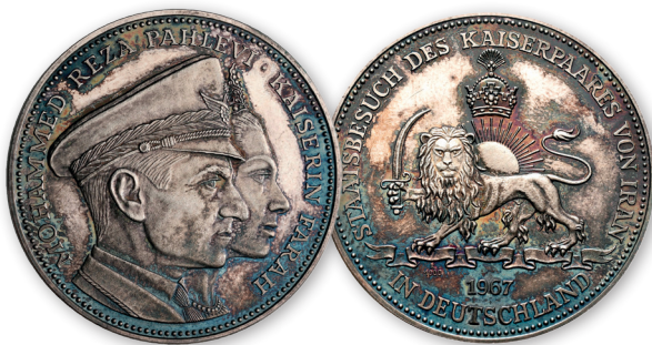
Los 655 | Ausruf: 50 € | Zuschlag: 2.600 €

Rücklosverkauf bis zum 26. Juli 2024! Unsold lots are offered until 26 July 2024!